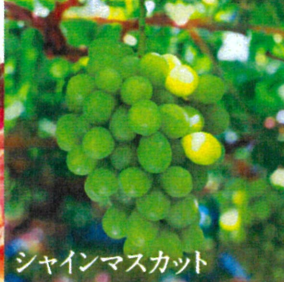
シャインマスカット