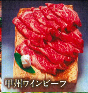
甲州ワインビーフ